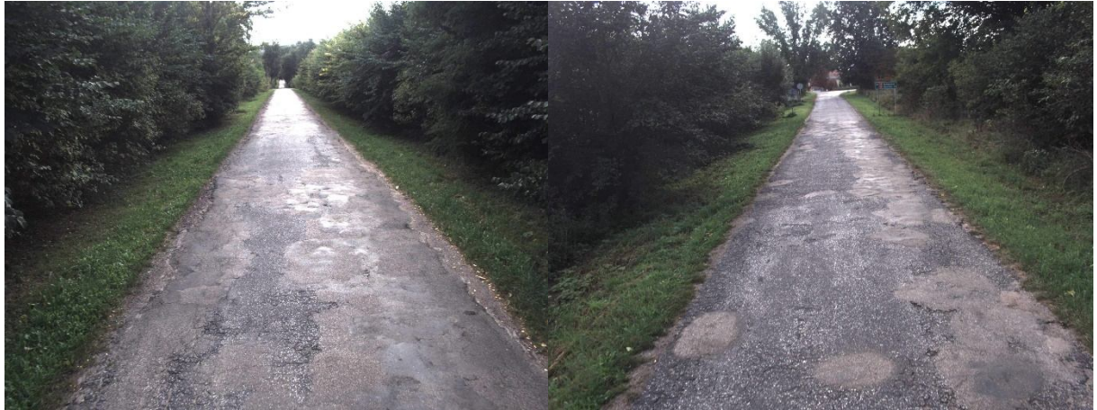
DP nr 1120C odcinek od km 4+776 do km 5+090